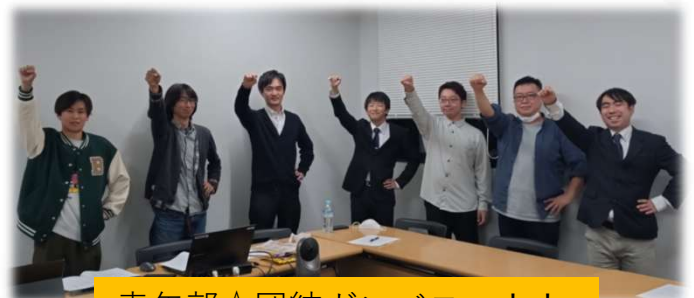
青年部☆団結ガンバロー！！