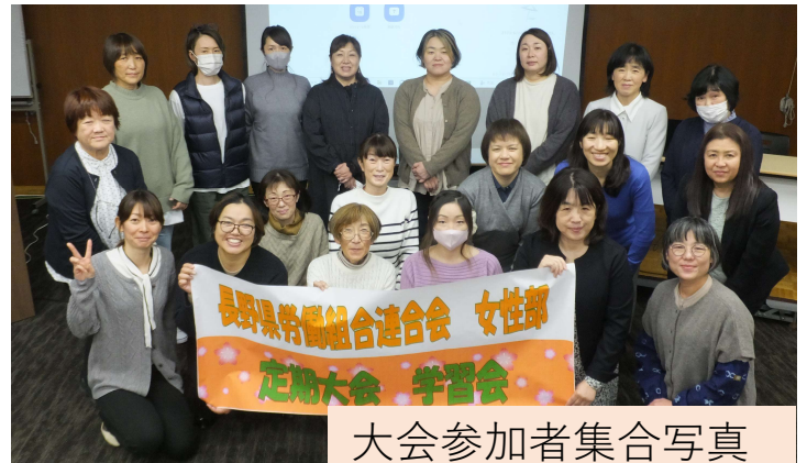
大会参加者集合写真