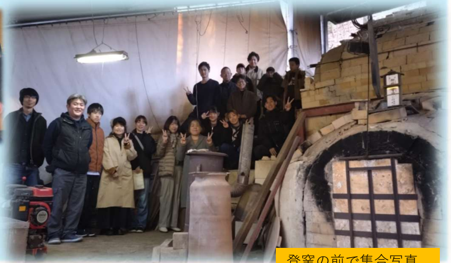
登窯の前で集合写真